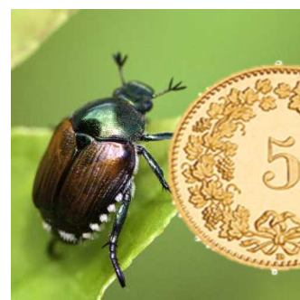
Figura 1: coleottero giapponese a confronto con una moneta da 5 cts.

Il coleottero giapponese ( Popillia japonica , Pj), classificato come organismo di quarantena prioritario, si distingue per la presenza di ciuffi pelosi bianchi (5 laterali e 2 più grandi nella parte posteriore) e per le sue piccole dimensioni, ovvero inferiori a una moneta da 5 cts (Figura 1). Esistono altri coleotteri molto simili coi quali ci si può confondere durante la determinazione. Nella Figura 2 sono illustrate le specie di insetti più comuni simili a Pj.