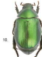
4 Anomala vitis Le specie appartenenti al genere Anomala ( Anomala vitis ), 14-18 mm e ( Anomala dubia ), 11-15 mm, sono interamente di colore verde tendente al marrone-nerastro.