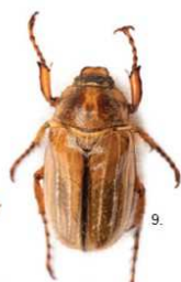
3 Amphimallon solstitiale Il maggiolino di San Giovanni ( Amphimallon solstitiale ), 14-20 mm, e il maggiolino europeo ( Amphimallon majalis ), 11-14 mm, non hanno ciuffi bianchi, possiedono elitre color bruno rossastro e pronoto scuro.