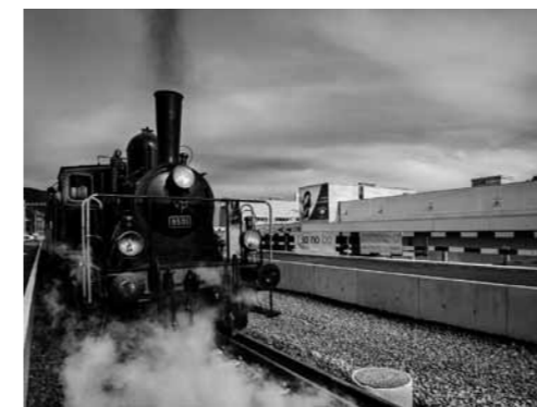
Vaporiera, Stabio 2013.

L'esposizione sarà affiancata da una pubblicazione che conterrà tutte le 80 fotografie della ricerca di Luisoni.