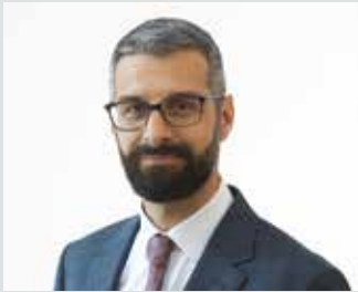
Cihan Aydemir, Capo dicastero cultura, sport, tempo libero e città dell'energia