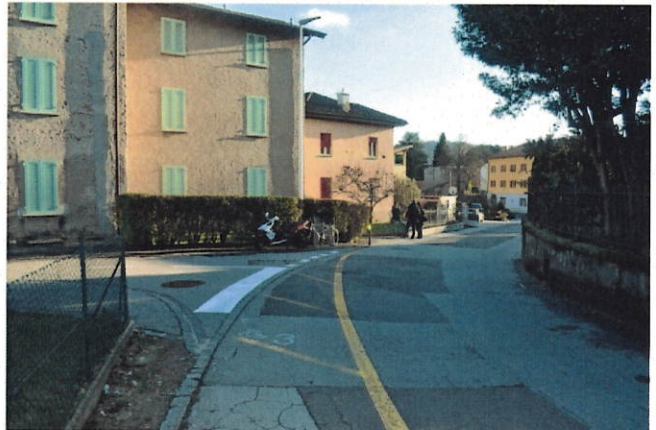
Figura 3: fine delle strisce gialle su Via Ponte di Mezzo

All'incrocio con Via Camiceria le strisce gialle finiscono (cfr. figura 3) lasciando gli utenti di mobilità lenta di fronte a delle alternative, ognuna delle quali con diversi svantaggi. Andare lungo Via Camiceria e affrontare un collegamento privato? Continuare su Via Ponte di Mezzo senza marciapiede, strisce o protezione di sorta? Come ben visibile dall'analisi seguente nessuna delle soluzioni attualmente praticabile invoglia davvero chi si sposta "lentamente".