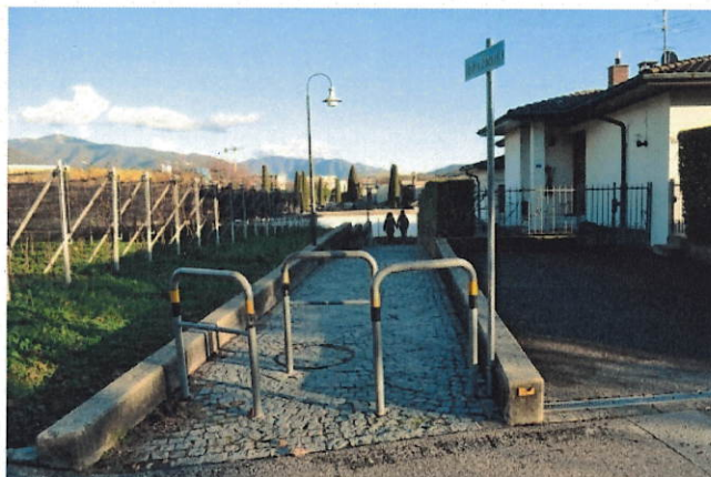
Figura 6: percorso 4, ostacoli alla mobilità lenta

4. Il percorso che scende su Via Ponte di Mezzo verso la SE, malgrado l'assenza di un marciapiede, ha un passaggio pedonale che porta al comparto SME-SI (cfr. figura 6). Questo passaggio pubblico è tuttavia scomodo per i pedoni che arrivano da Via Ponte di Mezzo ed è impossibile da utilizzare per i ciclisti, scomodo per le trotinettes e le inferriate risultano delle barriere architettoniche per passeggini. Il percorso è inoltre una notevole deviazione.