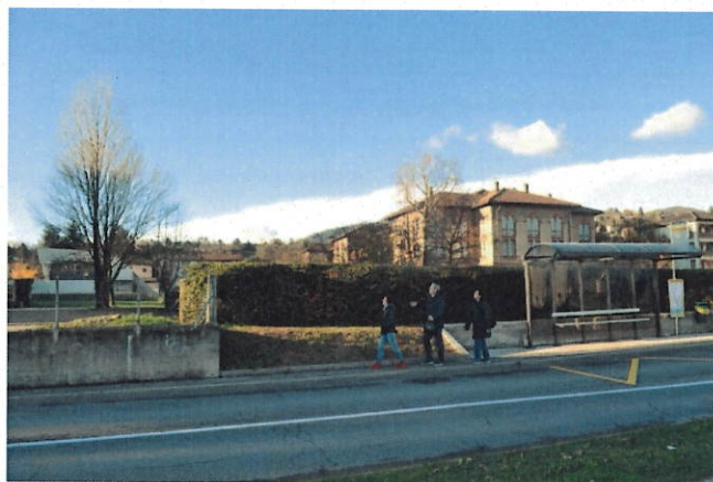
Figura 7: arrivo del percorso proposto