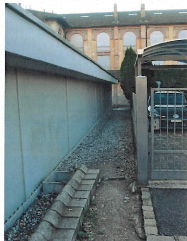
Figura 5: percorso 3, ghiaione sul passaggio privato

3. Sempre da Via Camiceria scende un altro percorso su strada privata che si collega con un passaggio stretto, pavimentato con ghiaione, che sbuca su Via Ligornetto in prossimità del bar Indios (cfr. figura 5). Questo percorso è uno di quelli privilegiati dai pedoni che si trovano tuttavia a disagio per l'aura di "illegalità" che tale passaggio incute oltre alla difficoltà di passaggio con mezzi muniti di ruote. Impossibile per sedie a rotelle, scomodo per biciclette, trotinettes, pattini, passeggini, ecc.