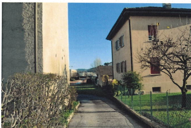
Figura 7: inizio del percorso proposto da Via Ponte di Mezzo

Il percorso proposto si trova accanto al numero civico 18 in Via Ponte di Mezzo, dopo la curva prima del ponte sul riale Gurungun e alla fine delle strisce gialle che in qualche modo proteggono i passanti (cfr. figura 7). Con un nuovo tracciato il percorso arriverebbe direttamente davanti al comparto SMe-SI (cfr. figura 8). I mappali coinvolti sarebbero i numeri 931 e 1983.