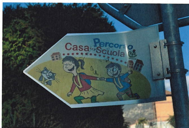
Figura 1: cartello Percorso Casa - Scuola elementare