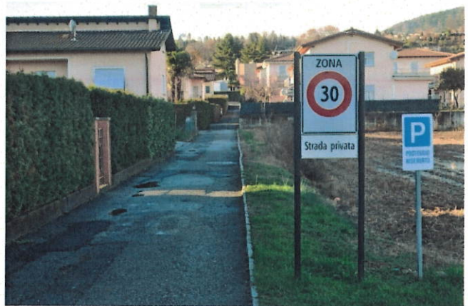
Figura 4: percorso 2 strada privata

2. Il percorso che da Via Camiceria porta in Via Ligornetto (vicino alla pizzeria Grillo Verde) attraversa una strada privata da cui poi si può proseguire sullo stretto marciapiede fino al passaggio pedonale in prossimità del comparto SME-SI (cfr. figura 4).